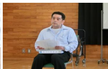
授業者のT先生 「学び」3年目に入る。 初めての先生方にとって 最高の授業を提供してく れた。